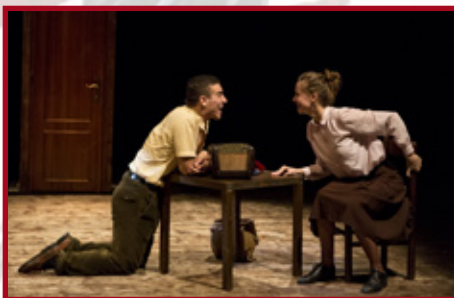
QUANDO C'ERA PIPPO