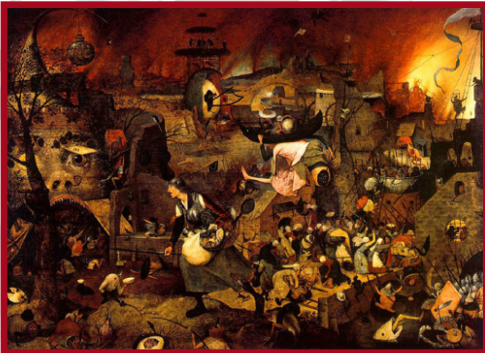
Bruegel il Vecchio DULLE GRIET (Greta la Matta) Olio su Tavola 115x161 cm 1561